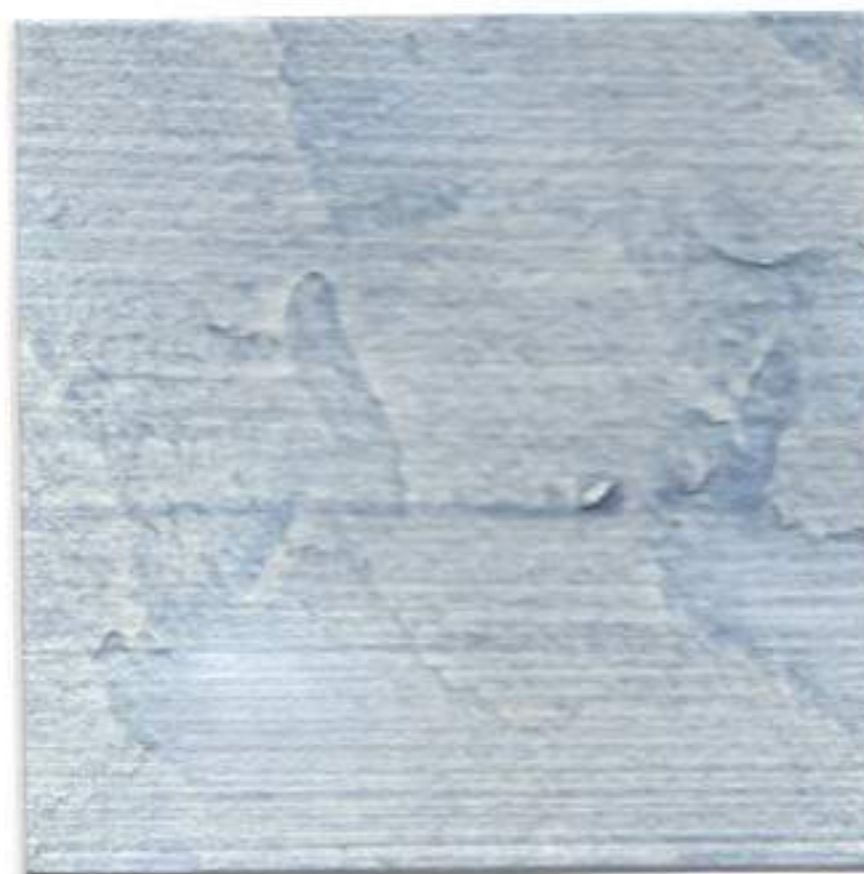
AZUL • BLUE