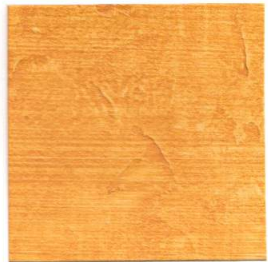
OCRE • OCHRE