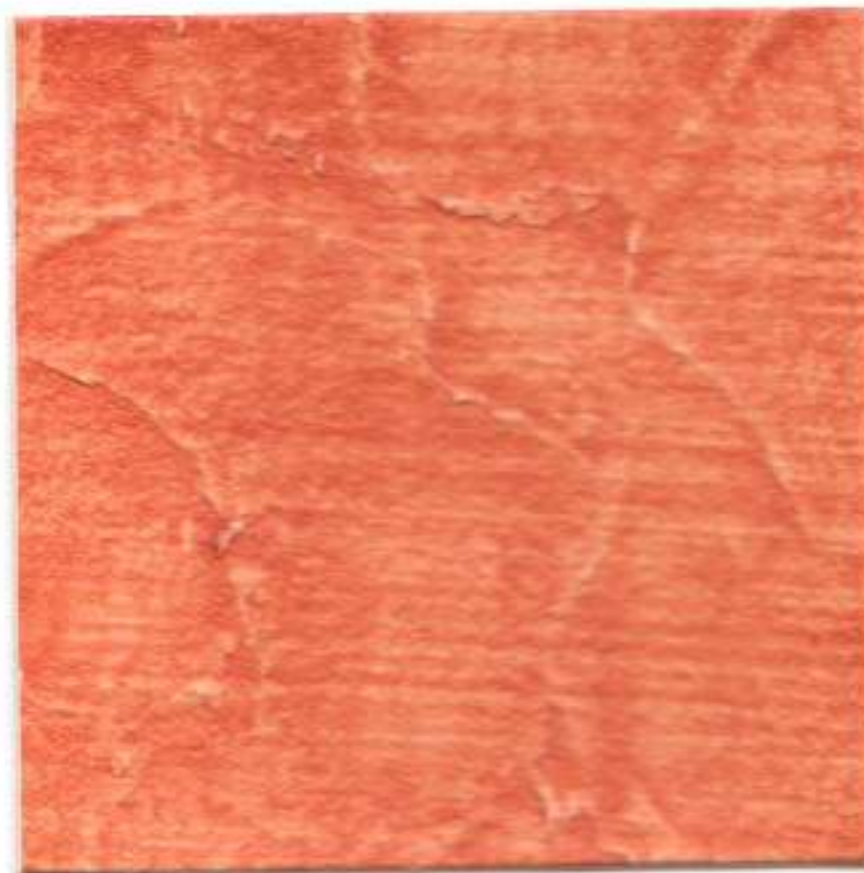
NARANJA • ORANGE