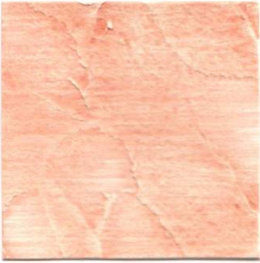
SALMON • SALMON