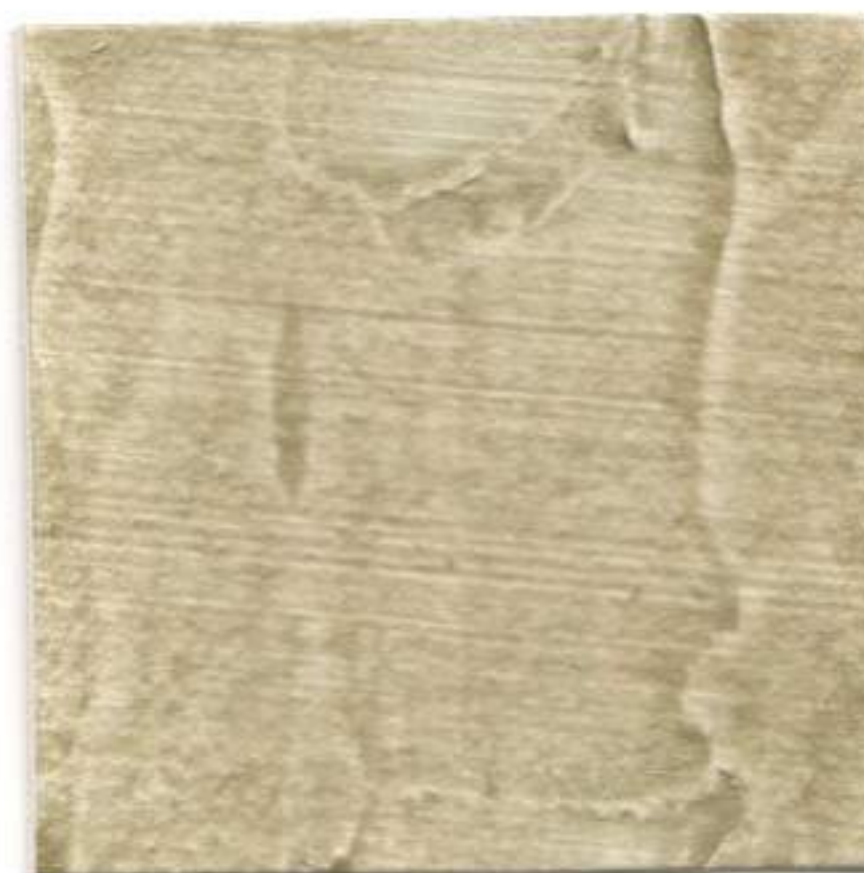
TUNDRA • TUNDRA