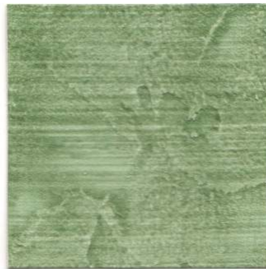
MUSGO • MOSS