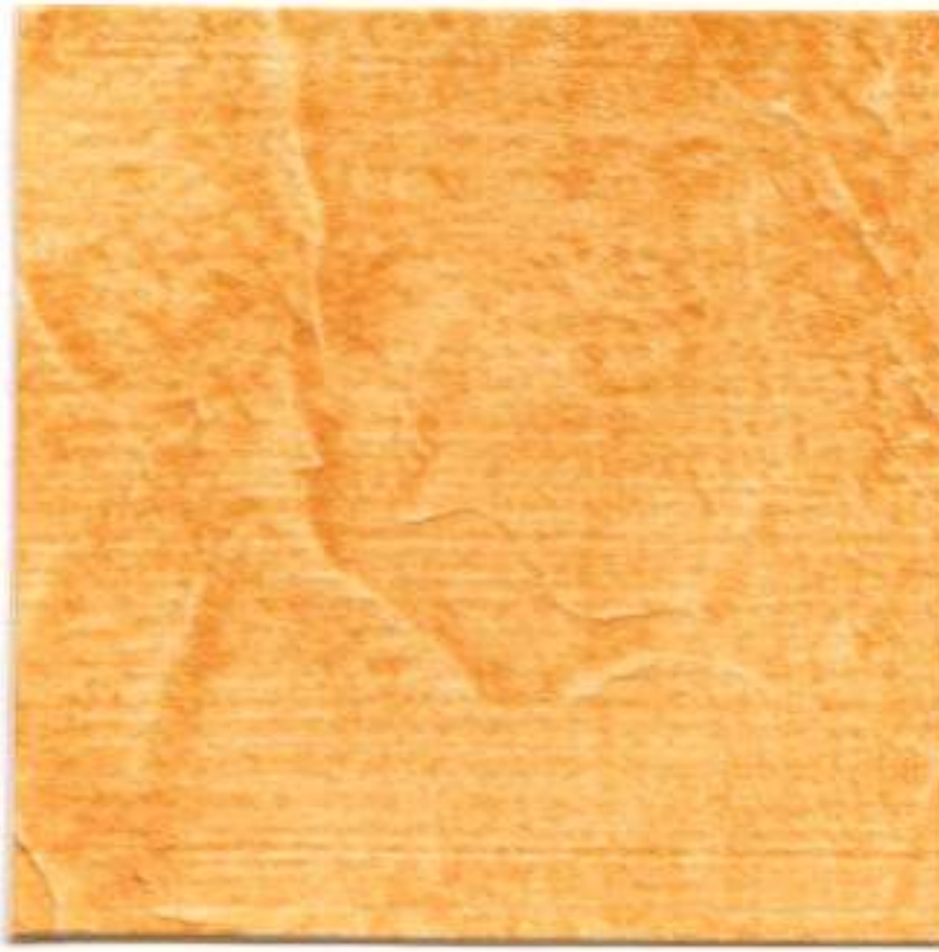
AVELLANA • HAZELNUT