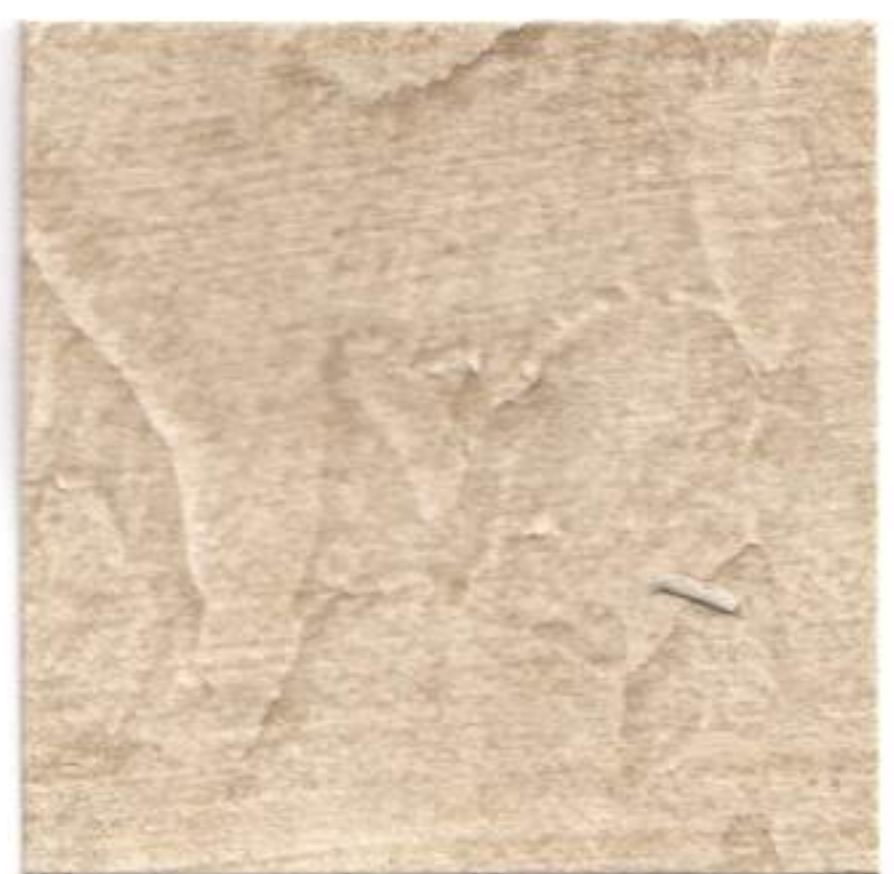
PIEDRA • STONE