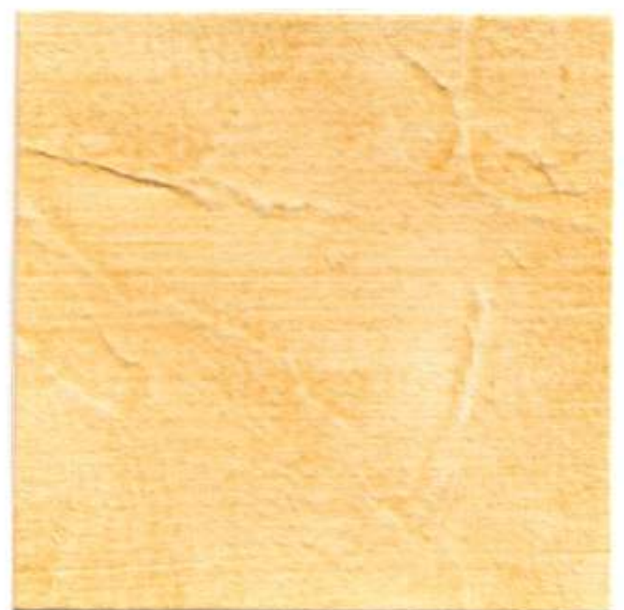
CREMA • CREAM