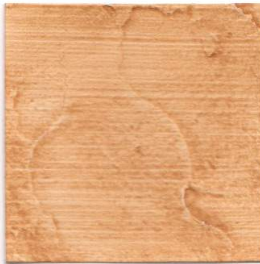
MARRON • BROWN