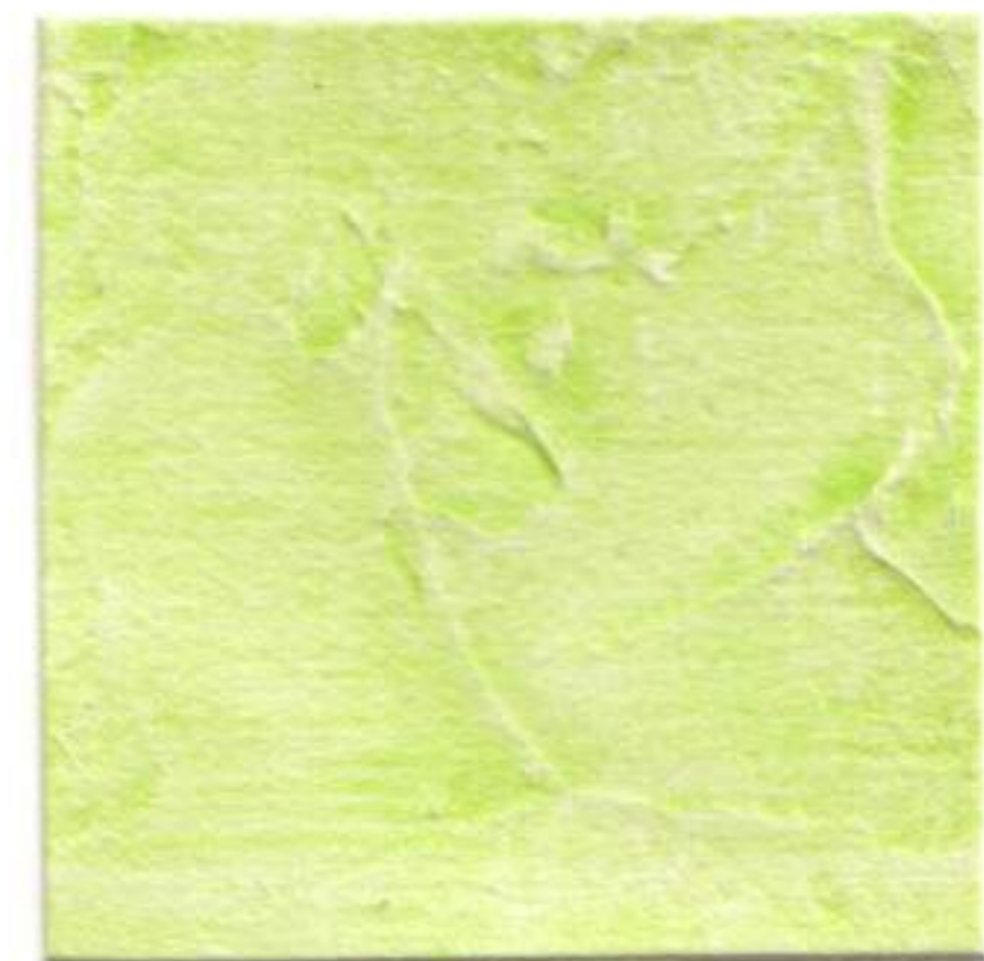
MANZANA • APPLE